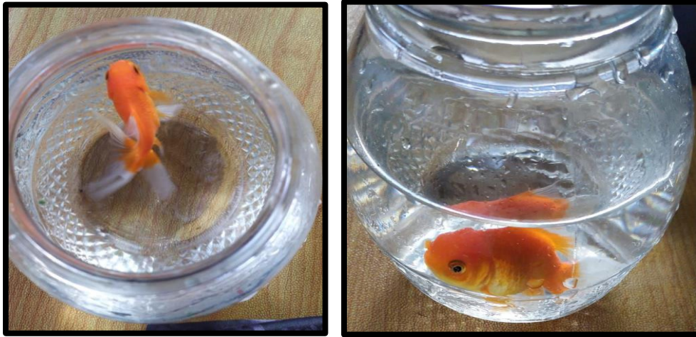
Ikan Mas Hidup Dalam Toples