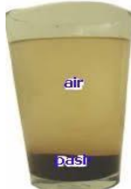
b) Campuran Air + Pasir