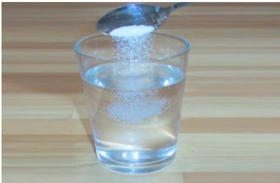
a) Campuran Air + Gula