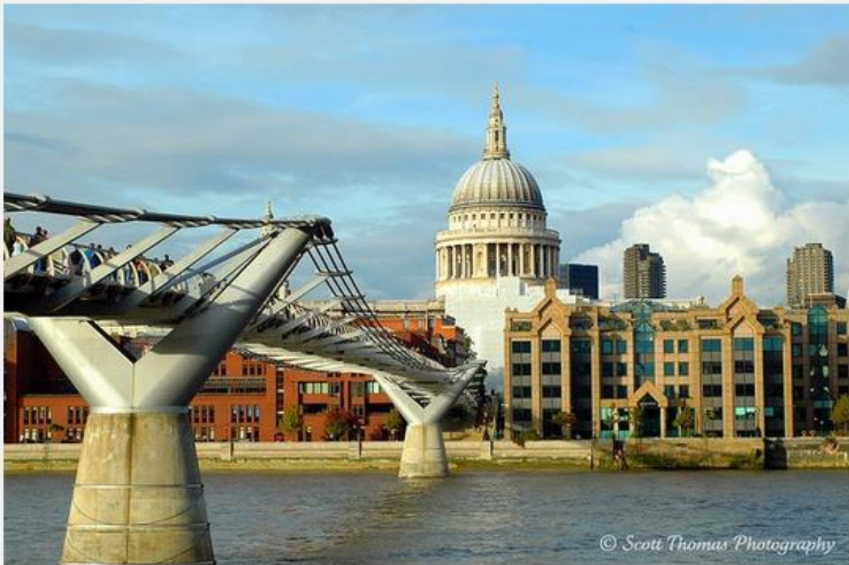
Nikon D70, 18-70G lens, 1/250s, f/8, ISO 200, EV 0, 48mm focal length

Millennium Bridge over the River Thames in London, England with St. Paul's Cathedral on the other side partially covered in scaffolding for renovations being done back in October of 2005. The Millennium Bridge opened in June of 2000 but was closed almost immediately for its own renovations. Nicknamed the Wobbly Bridge after participants in a special event to open the bridge felt an unexpected and, for some, uncomfortable swaying motion during the first two days after the bridge opened. The bridge was closed for the next two years to make modifications to eliminate the swaying motion. I can tell you when I walked over it in 2005, there was no swaying motion.