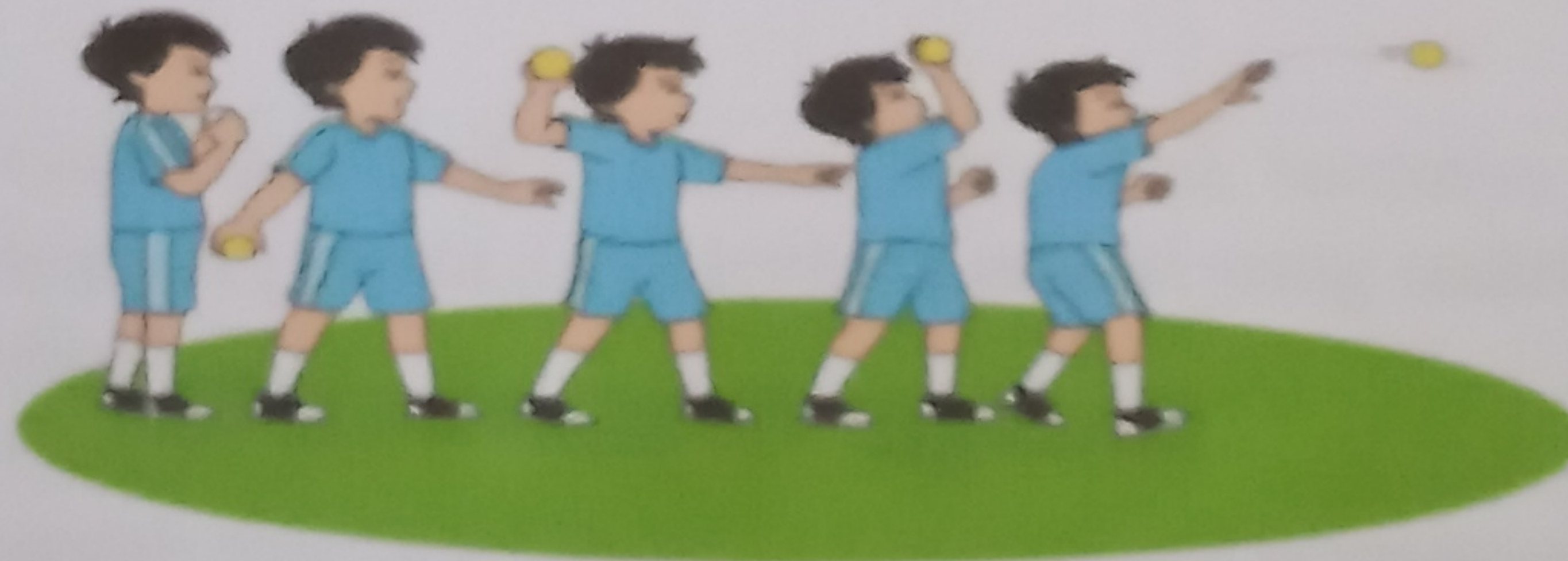
Teknik Melempar bola melambung