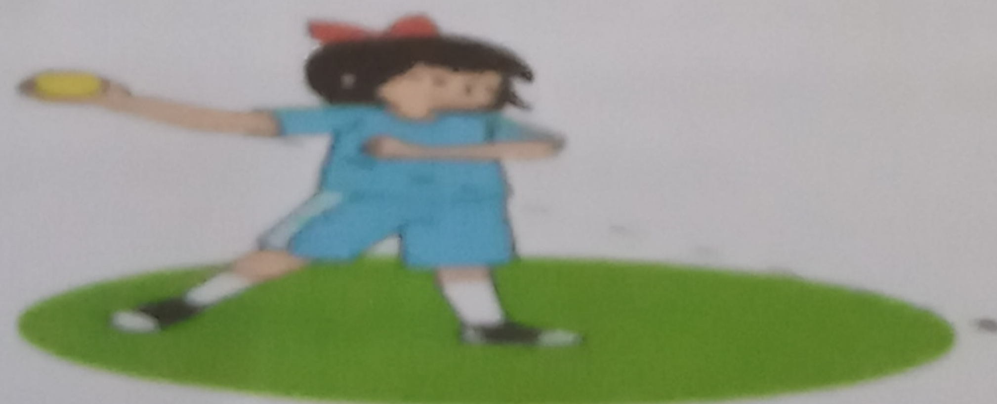
Teknik lempar menyusur tanah