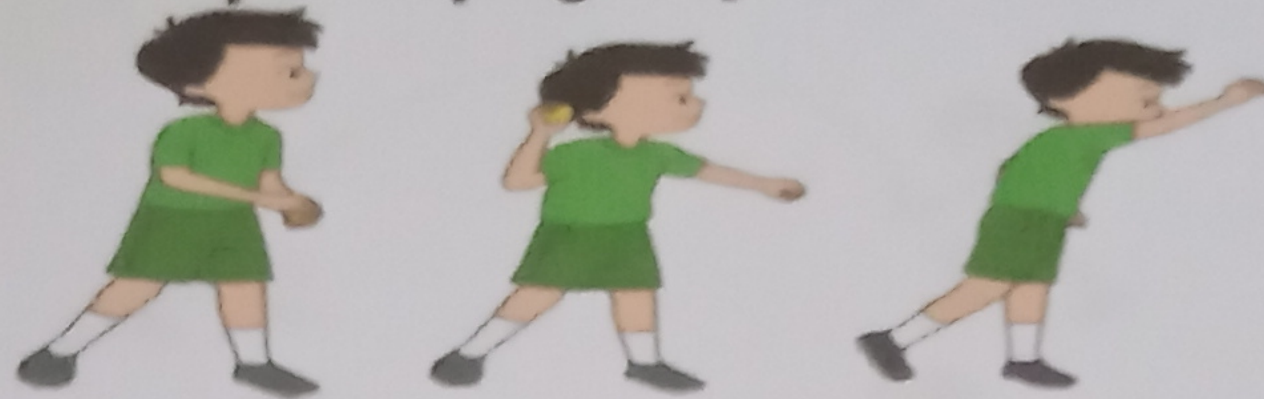
Teknik Melempar bola mendatar