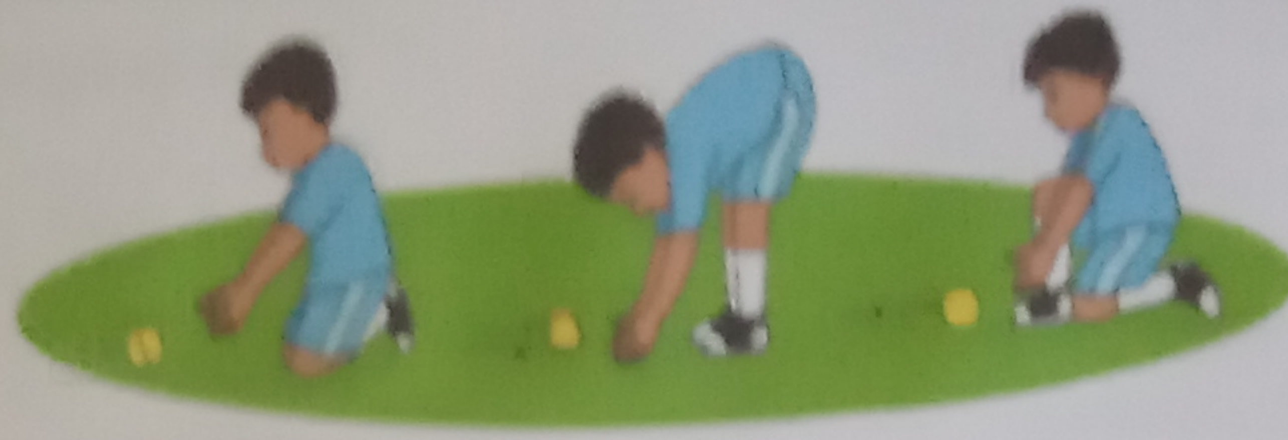
Teknik Menangkap bola menyusur tanah