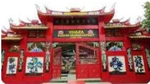
VIHARA Tempat ibadah Budha